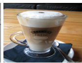
Bauhaus Cafe Latte